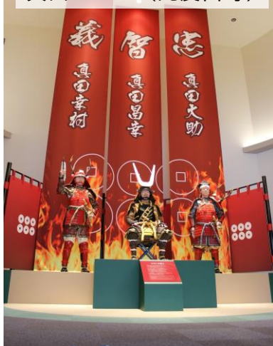
真田ミュージアム(九度山町)