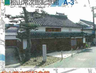
松山常次郎記念館 A-3