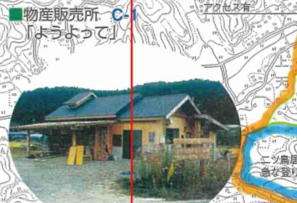
物産販売所 C-1 「ようよって」